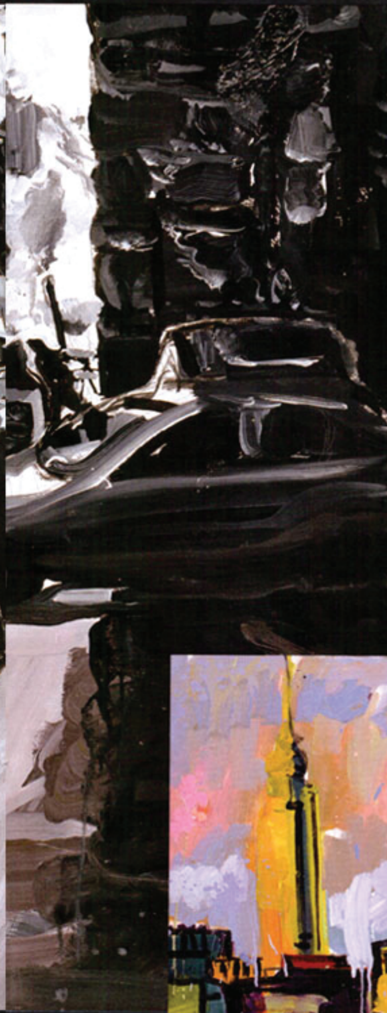
NEW YORK IS NOIR AGAIN, 2008. Acrylique sur toile, 81 x 107 cm.

New York n'en finit pas de l'inspirer. Ambassadeur de l'acrylique dont il exploite la force colorée dans une touche de plus en plus fluide, Christopher exalte une réalité bouillonnante à travers les rues de la mégapole bruyante et encombrée de taxis klaxonnant. Une foule animée d'un mouvement sans répit. Un brouhaha constant qui cache l'absence de communication entre les êtres? Inédites, les toiles en monochrome gris expriment peut-être ce froid constat.