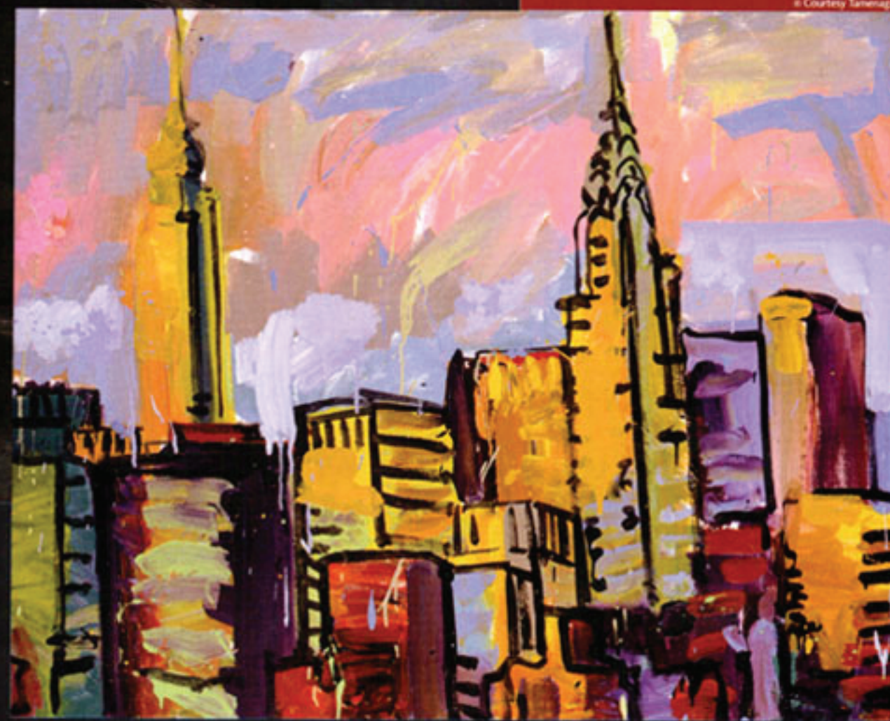
THE CITY SANG IN NOTES ALL COULD HEAR, 2008. Acrylique sur toile, 122 x 153 cm.