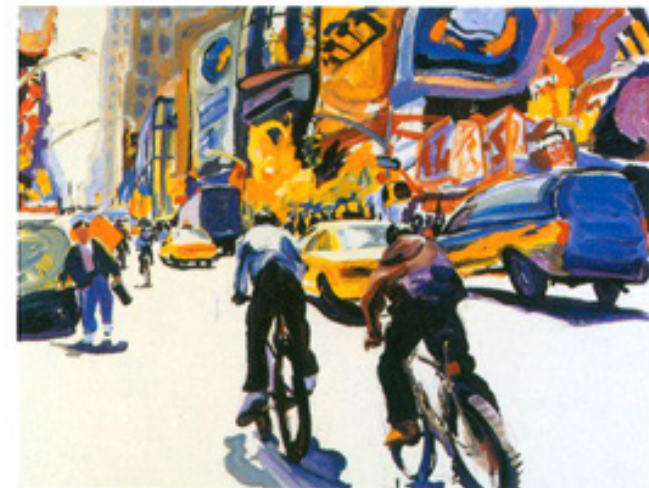
Page de gauche, Times Square Crossing, ci dessus, Taxi Jam II et, ci-contre, Two messengers, trois peintures au point de vue surprenant et riches en mouvement qui entraînent l'observateur dans le flux incessant de New York.