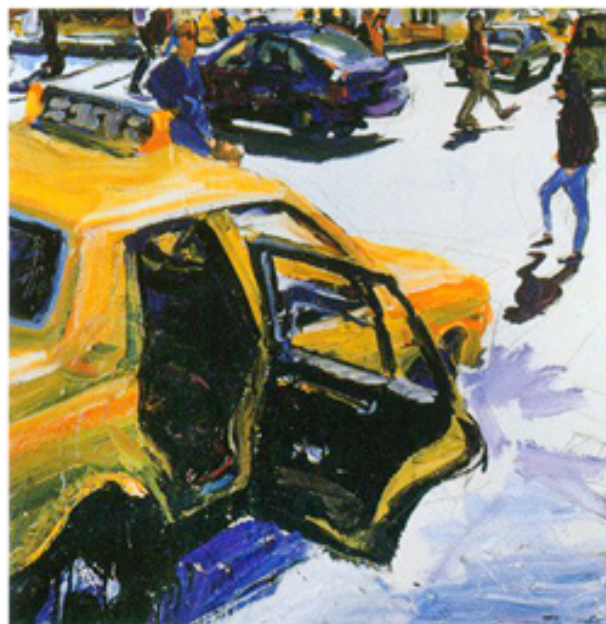
Cab at Bryant Park, un instantané de la vie new-yorkaise. Un taxi jaune s'arrête, son client a déjà fui et le peintre devient le témoin d'une ville qui ne s'arrête jamais. Page de droite, Broadway to 42nd, ou la difficile cohabitation entre les vélos et les taxis en surnombre.